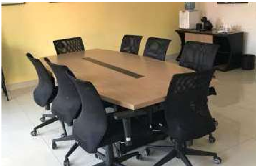
Salas de reuniões