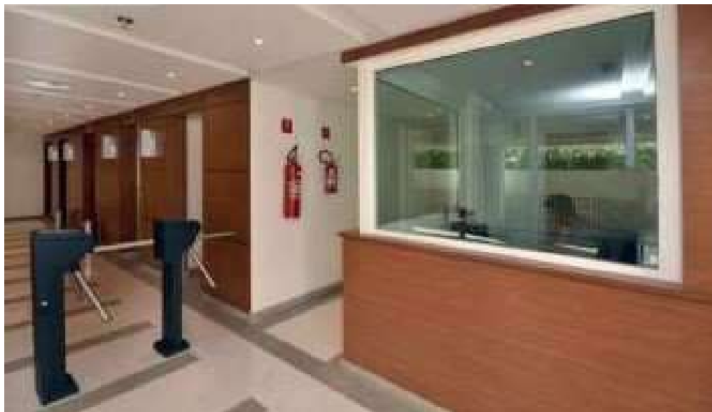
Segurança 24 horas