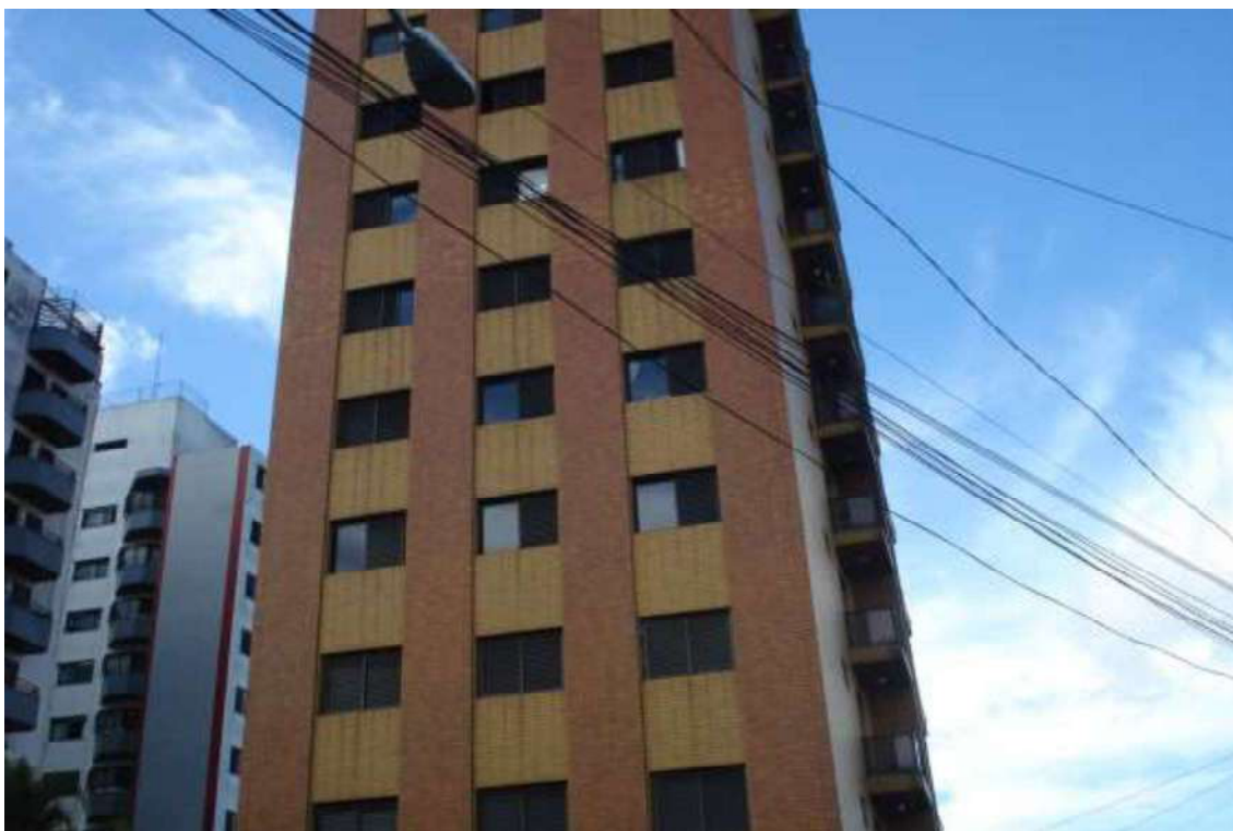
FOTO Nº 02 – Vista da Rua Dr. Vicente Giacaglino à direita do Condomínio Edifício Della Colina.