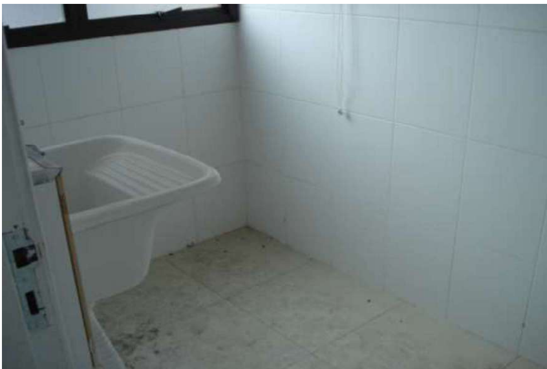
FOTO Nº 10 – Vista da entrada na suíte e banheiro no apartamento paradigma.