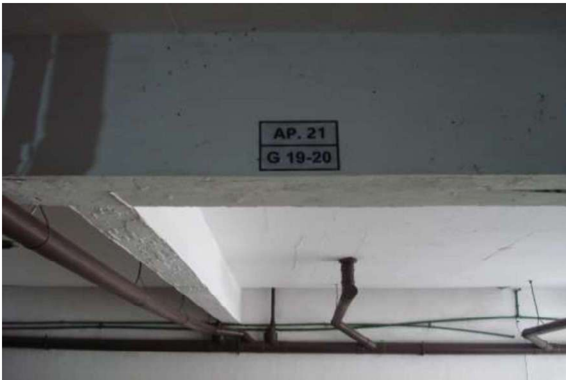
FOTO Nº 16 – Vista das vagas na garagem do apartamento avaliando.

FOTO Nº 15 – Detalhe da identificação das vagas na garagem do apartamento avaliando.