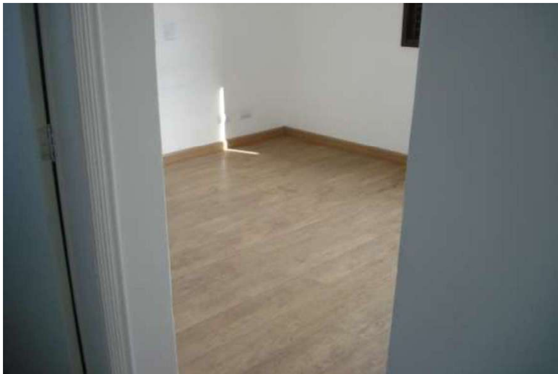
FOTO Nº 12 – Vista do segundo dormitório no apartamento paradigma.